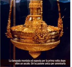
La lampada montata ed esposta per la prima volta dopo oltre un secolo. L'occasione unica per ammirarla