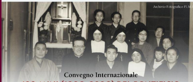
Archivio Fotografico P.I.M.E.