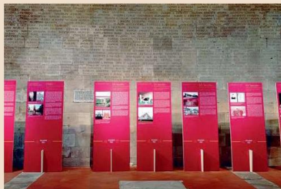
FOTO: al centro della pagina l'isola di Amakusa dove si svolse la mostra nelle settimane di agosto; a destra la locandina di Thesaurum Fidei; Giulietti a Nagasaki; in basso a destra il luogo che ricorda la prigione dell'Orsucci; qui a fianco la mostra nel 2023 in San Cristoforo a Lucca.

di nuovo possibile vivere in modo sempre più aperto. Anche se, va detto, pur senza persecuzioni, si è dovuto attendere la seconda metà del '900 per il riconoscimento reale da parte della popolazione tutta e non solo dalle autorità. La religione cristiana oggi rappresenta circa il 1% della popolazione. Nella cultura comune permea però qualche cristianità. Così come «Se vuoi fare carriera evita di dire di essere originaria di Amakusa» - cioè di un'isola nel sud del Giappone che, come tutta l'area attorno a Nagasaki, è identificata come il territorio dove è più diffusa la religione cristiana - ancora sono piuttosto radicate e, inoltre, la storia dei cristiani nascosti con difficoltà viene riconosciuta e letta sui libri di storia, tanto che la popolazione spesso ancora oggi non è consapevole di questa presenza.