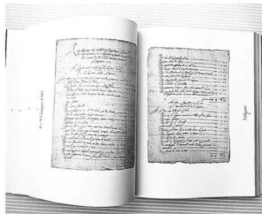
「天正遣欧少年使節」の記録を集めた書籍に掲載された史料。6月、ローマ（共同）

か、ベネチアやミラノなど各都市も訪問した。 書籍は「TENSHO 天正」のタイトルで、約530ページ。編者らによると、史料には教皇の指示を受けた高位聖職者が少年使節の歓待を各都市に要請する書簡があった。実際に使節は各地で音楽や豪華な食事でもてなしを受けた。 中部フオーリーニョに残されていた記録には長い食材の購入リストがあり、使節の到着に向けて入念な準備が進められていた様子が浮かんだ。 編者でパビア大のオリンピア・ニコ教授は「西欧文化の素晴らしさを伝え、日本での宣教活動に好影響を与える狙いがあった」と分析した。