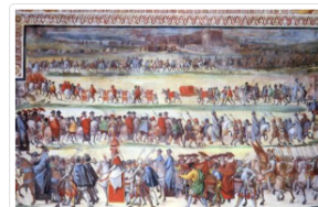
La "cavalcata" di Sisto V col corteo dell'Ambasceria Tensho affrescata nel Salone Sistino della Biblioteca Apostolica Vaticana

Roma (Agenzia Fides) – Lettere, documenti, richieste di oggetti particolari e anche l'ordine, giunto direttamente dal Papa, di riservare un'accoglienza speciale a chi viaggiando per mesi aveva attraversato il Continente asiatico per giungere a Roma con l'obiettivo di conoscere e apprendere al meglio la dottrina cattolica.