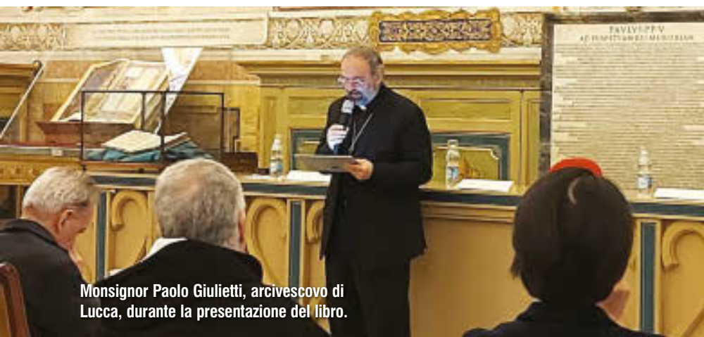
Monsignor Paolo Giulietti, arcivescovo di Lucca, durante la presentazione del libro.

stimoni coraggiosi nel mondo di oggi». Fare memoria dei missionari che decisero di spendere la propria vita fino al sangue per condividere il tesoro della fede, ricordare un popolo che ha custodito per generazioni questo tesoro pagando un prezzo altissimo, «dice ancora oggi, alla nostra Chiesa, che non è la stessa cosa aver conosciuto Gesù o non averlo conosciuto», chiosa l'arcivescovo di Lucca, perché «la loro esistenza, anche dinanzi alla prospettiva del martirio, o in mezzo ai disagi e a rischio di una vita vissuta nel nascondimento, è stata riempita di gioia, una gioia che il mondo non può comprendere perché è la gioia del Vangelo, la gioia dei discepoli di Gesù. Chiunque collabora a diffonderla, non perderà la sua ricompensa». □