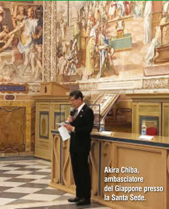
Akira Chiba, ambasciatore del Giappone presso la Santa Sede.