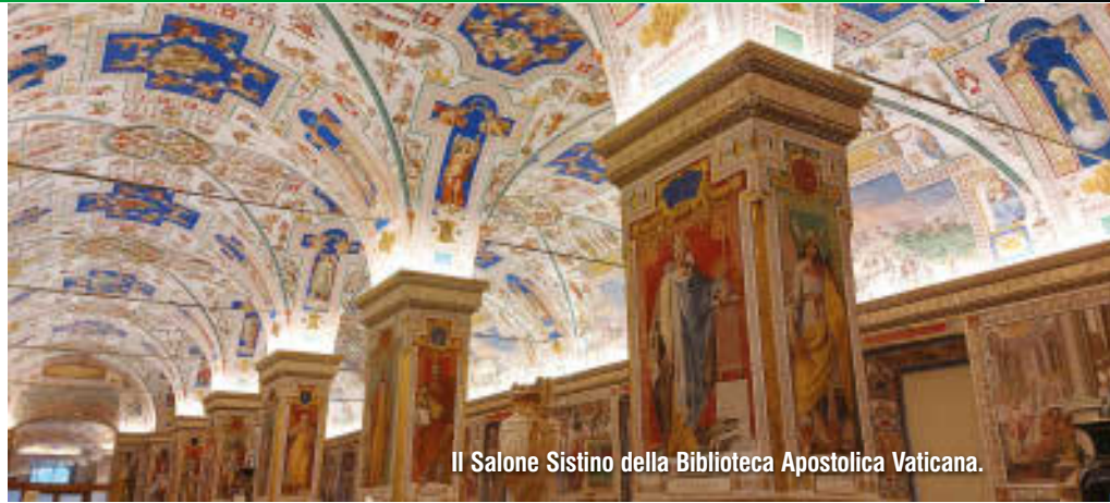
Il Salone Sistino della Biblioteca Apostolica Vaticana.

mostra in memoria dei testimoni della fede in Giappone nei tre secoli di persecuzioni, esposizione che successivamente è stata allestita a Roma, alla Pontificia Università Urbaniana e alla Pontificia Università Gregoriana (per approfondire: www.diocesilucca.it/thesaurumfidei ).