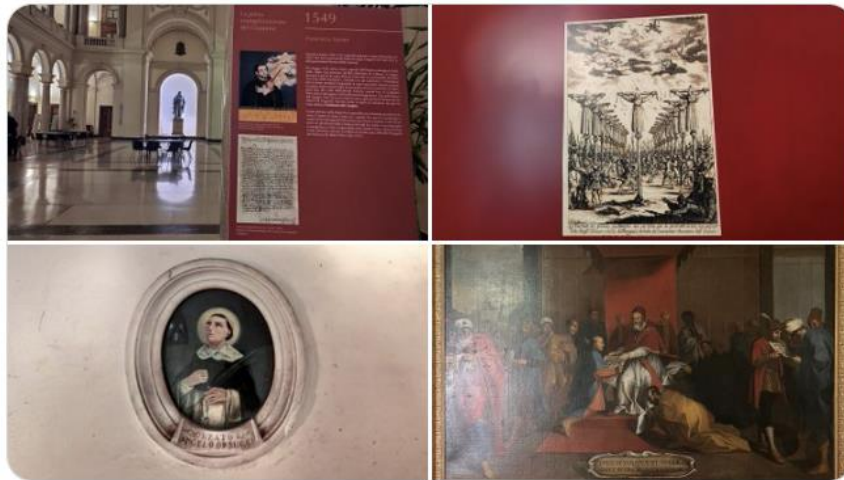
Tu e Arcidiocesi di Lucca

In contemporanea, riproposta una seconda mostra sul Giappone alla @UniGregoriana: "Thesaurum Fidei. Missionari martiri e cristiani nascosti in Giappone. 300 anni di eroica fedeltà a Cristo" visitabile fino al 23 febbraio.