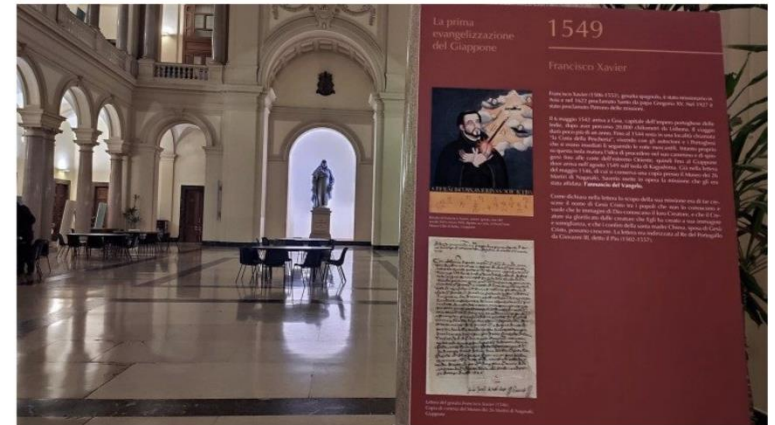
La mostra Thesaurum Fidei all'Università Pontificia Gregoriana

In contemporanea, una seconda mostra sul Giappone alla Università Gregoriana