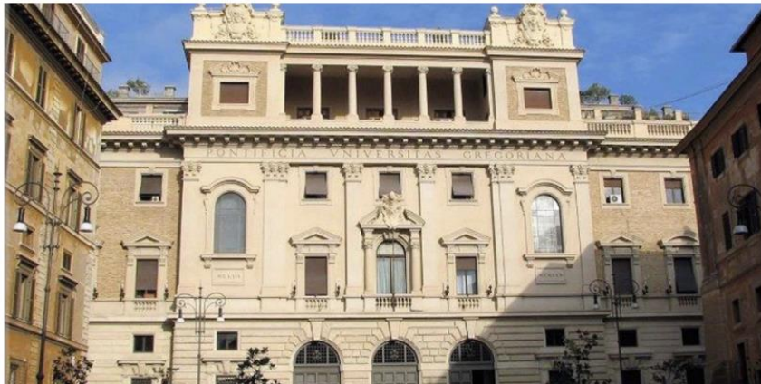
Pontificia Università Gregoriana.

Dal 19 al 23 febbraio 2024 articolo aggiornato: 5 febbraio 2024