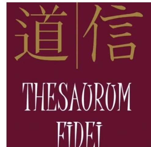
| Pontificia Univ. Urbaniana

https://www.acistampa.com/story/24107/urbaniana-dimostrazione-della-cerimonia-del-te-per-la-mostra-sui-missionari-martiri