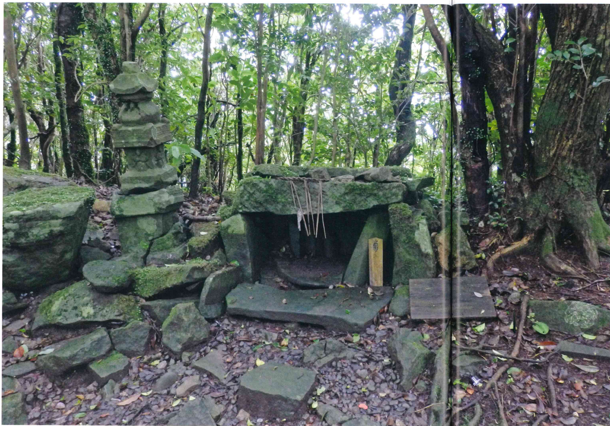
A sinistra, i resti di un antico altare cristiano sul monte Yasumandake, sull'isola di Hirado. A destra, abito e crocifisso di un missionario gesuita, nel Museo dei Kakure Kirishitan, sull'isola di Hirado.