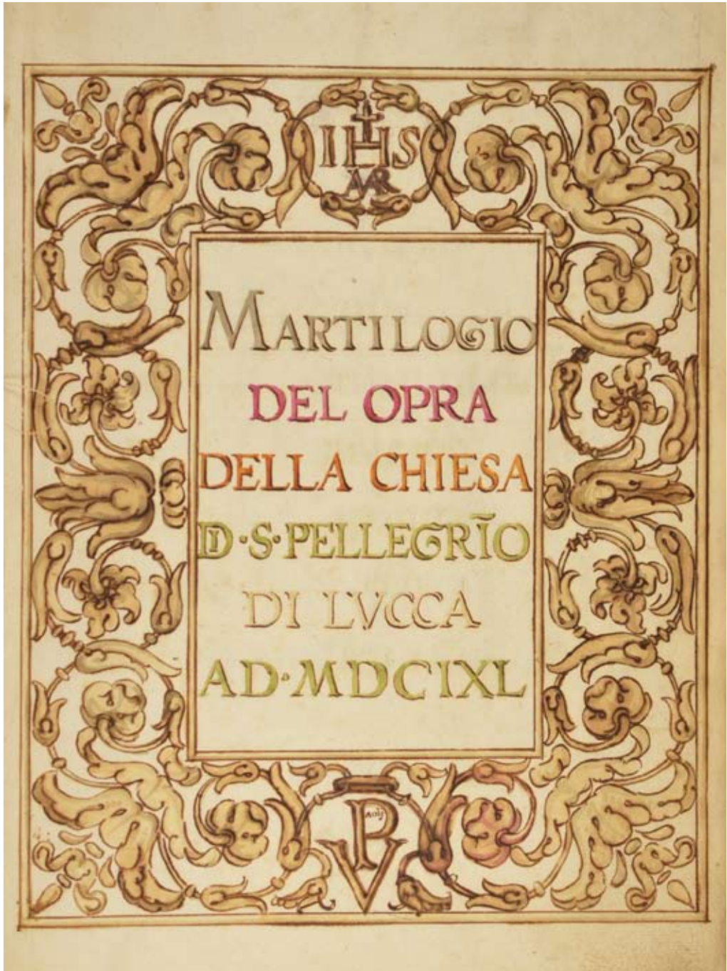
2. Lucca, Archivio Storico Diocesano, Archivio Arcivescovile, Enti religiosi soppressi , 3306: frontespizio, c. Ir.